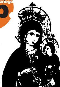
Opolska Pani, Tyś naszą Matką